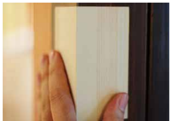
壁のコーナーに貼ることが可能