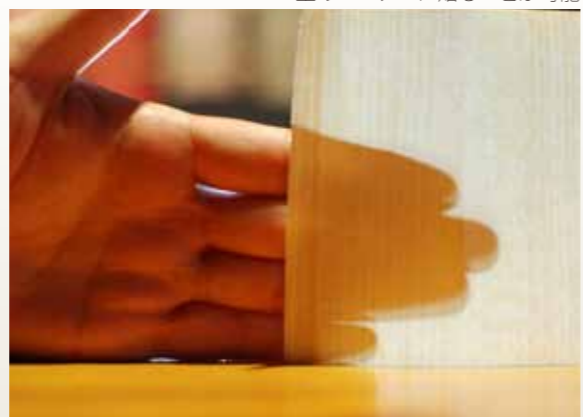
裏が透けるほどの薄さ